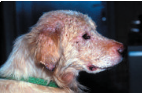
Hund mit Leishmaniose (li.), Malteser mit Augentzündung (re. oben) und Spulwürmer im Dünndarm (re. unten)

Zoonosen wie Tollwut, Leishmaniose und Toxoplasmose gefährden Mensch UND Tier, Parasiten (Babesien, Spulwürmer, Bandwürmer etc.), bakterielle (Borelliose, Leptospirose, Salmonellose etc.) und virale Erkrankungen (Tollwut, Staupe, Parvovirose etc.) stellen ernstzunehmende Bedrohungen auch für andere Hunde dar.